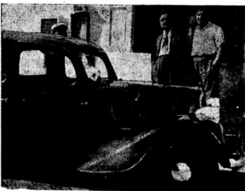
אפילו „גזח“ יש כבר בשכונה