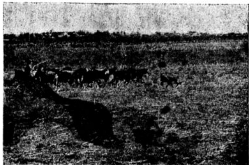
לפני שנתיים רעו עזים במקום השממה...

שכונת „התקוה“, שנתפרסמה בימי המאורעות לא פחות מאדום אכיבה בימי מלחמת הכיש