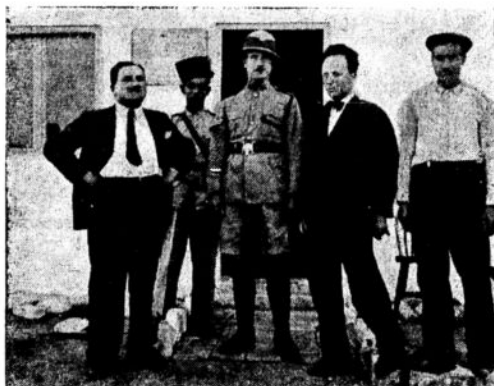
על יד תחנת המשטרה