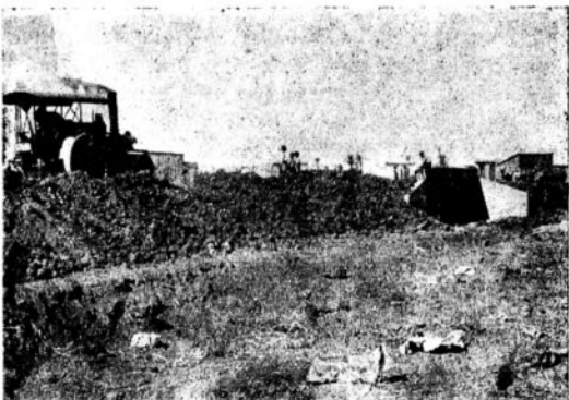
המכבש מתחיל בסלילת הכביש

הולכת ומתפתחת לרובע עירוני של תל-אביב. פרבר גדול רחב ידים. יש בה תחנת משטרה, שנקבעה בימי המאורעות, בית הכנסת הולך ונבנה והשכונה היולכת ומתרחבת.