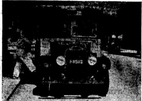
כה היו נוסעים בימי המאורעות לשכונת "התקוה"

ותבל, באמת... וליכא מידא דלא רמיוא בניטריקו, והא ראוה: הן זוכרים אתם בראי את רשומת הבחירות, שהגיע המנוח דיוננף לבחירות אחרונות של מועצת העיריה בחא: לדעתם, בקי יותר בלונדון ויש לו מחלה כיום שם בחלונות הגבוהים, עוד כנסתיי האחרונה, ואולם אין מול לאנגליה: עד שלא באו כאן לידו הסכם בין שני המדינות עמדים לתוך, והנה הודעה בלונדון שם בלונדון וסדר בעצמו את הענין על הצד היתר טוב.