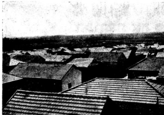
שכונת „התקוה“ כיום מאוכלסת 3000 איש