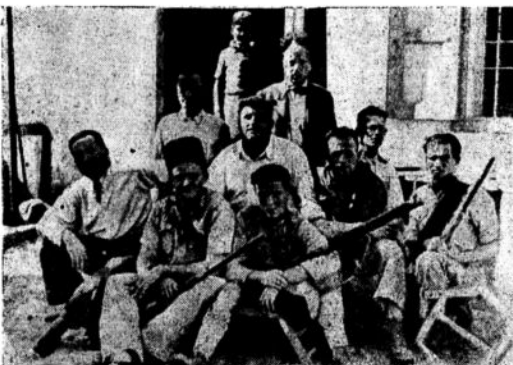
הגאפירים של השכונה בשעת מנוחתם