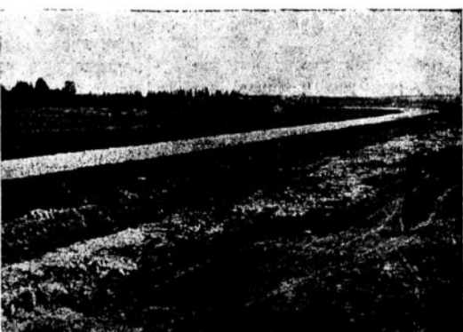
הכביש מתל אביב לשכונה